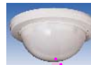
人の動きセンサー