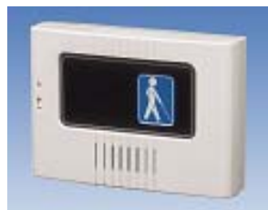
チャイム本体(タイマー付) UD-T