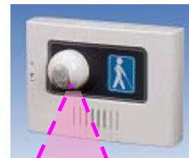
チャイム本体(センサー付) UD-S