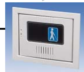
オプションの埋込BOX設置時