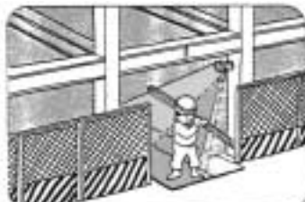
●工事現場・作業現場での照明灯として