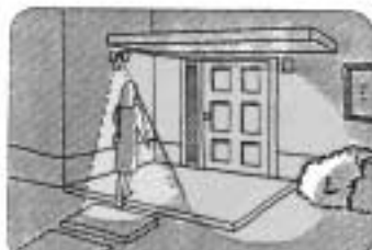
●玄関口・通路などの照明灯として