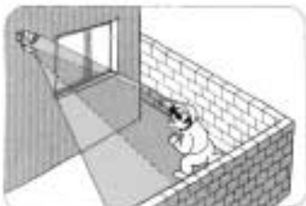
●侵入者を威嚇する防犯灯として